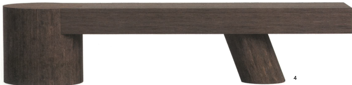
1 Une collection de vases uniques issus d'anciennes cloisons en plâtre. A collection of unique vases from old plaster partitions. Popit Paris, vase Trudaine, design Tom Poinot 2 Le skateboarder Keith Hufnagel s'associe à G-Shock pour commémorer le 20 e anniversaire de la marque HUF. Skateboarder Keith Hufnagel teams up with G-Shock to commemorate the 20th anniversary of the HUF brand. Casio, G-Shock, Série 2100 GA-2100HUF-5A 3 La nouvelle série de travaux de Jos Devriendt explore l'ancienne technique céramique du raku. Jos Devriendt's new series of work exploring the ancient ceramic technique of raku. Demisch Danant, Jos devriendt 4 Banc en bois de chêne fumé. Wooden bench smoked oak wood. Studiotwentytseven, Perenne 02 Bench, design Thomas Moisan