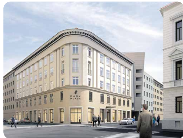
Renderi arhitektonskog rješenja hotela, ulazno pročelje (gore) i krovna terasa (dolje)

za prosinac 2022. godine, otvorenje hotela je odgođeno), "art'otel" dovest će goste u jednu od rijetkih uspješno obnovljenih do-njogradskih palača, a oni će iz bazena na njenom krovu gledati u željeznu čipku oko tornjeva katedrale, možda čuti i zvukove s okolnih gradilišta koja neće tako skoro skinuti svoje cerade. Imat će na dlanu Zagreb u njegovoj srži. A Židovi koji su ga gradili? Gdje će saznati za njih?