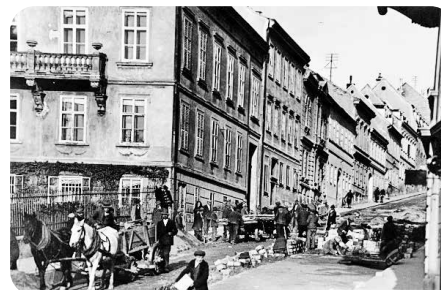
Fotografija Zagreba iz ranih 30-ih, Mesnička ulica