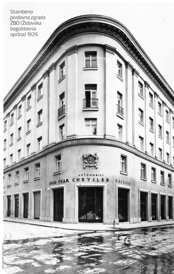
Stambeno poslovna zgrada ZBO (Židovska bogoštovna općina) 1929.