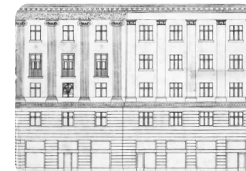
Freudenreich i Deutsch, projekt pročelja palače. 1928.

Vjerojatno je većina stanovnika Zagreba danas poznajemo, i dalje identitetom usidrenog u povijesnu cjelinu Donjega grada, ne bi bilo bez djelovanja njegove židovske zajednice.