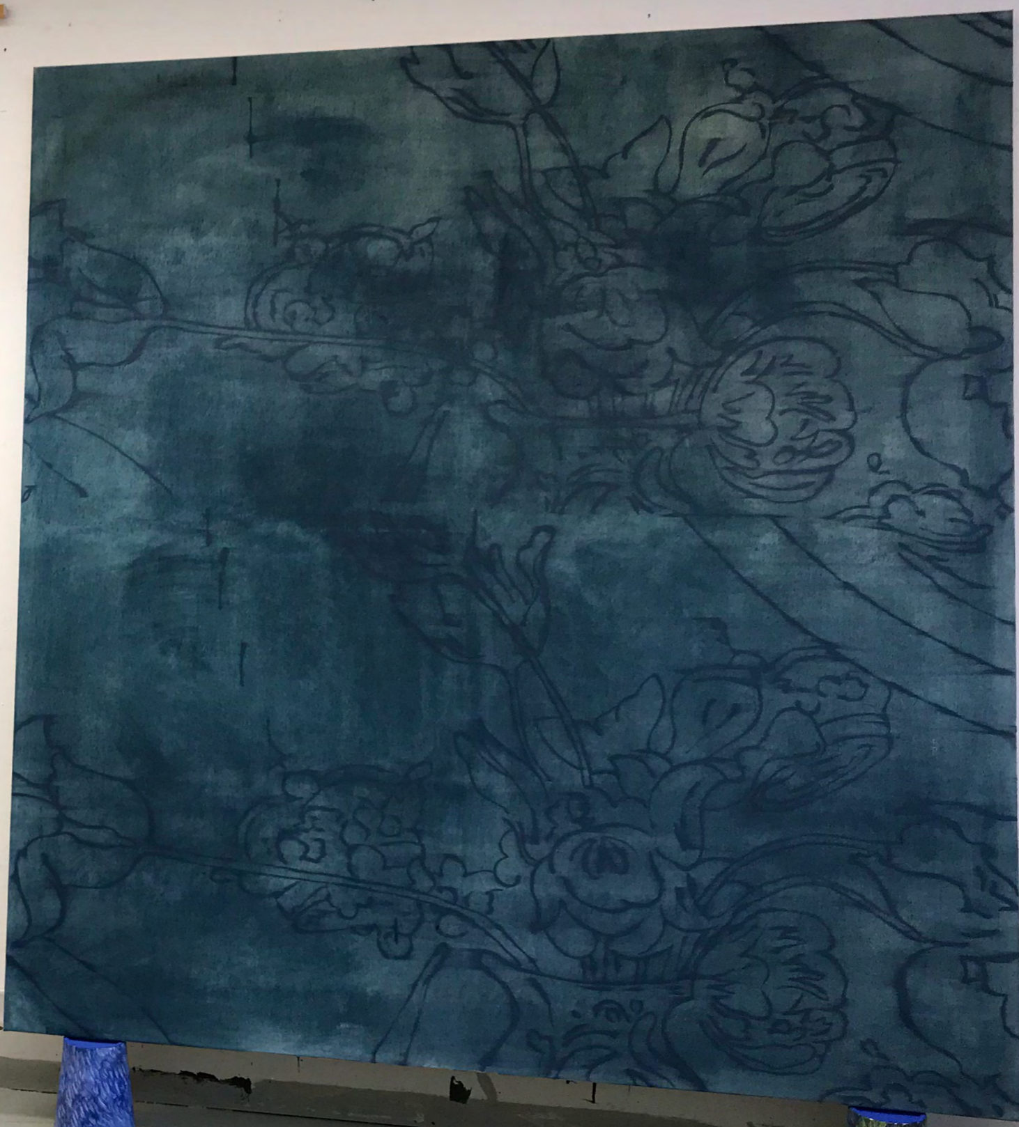
JOHAN ENGVIST, 1.- Detail. <left> 2.- Oil on canvas, 160 x 150 cm, (2020). <right>