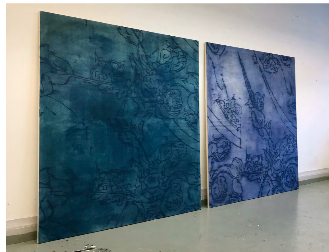
JOHAN ENGQVIST 1.- Oil on canvas, 160 x 150 cm, (2020). 2.- Oil on canvas, 160 x 150 cm, (2020).