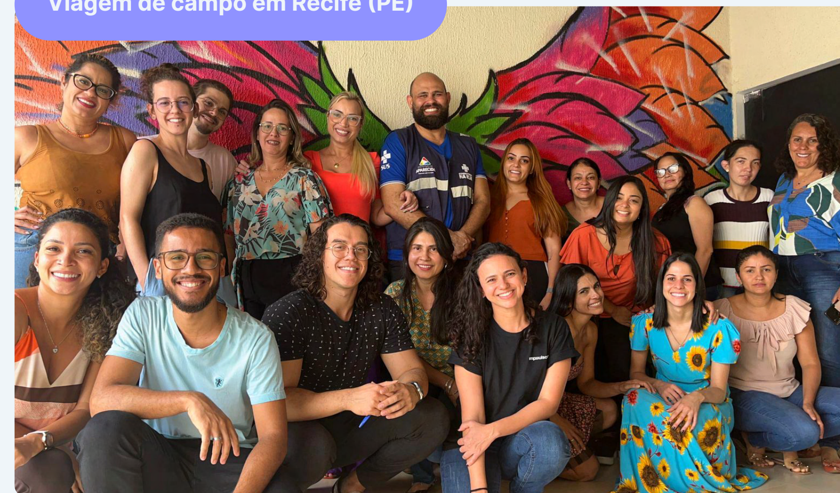
Viagem de campo em Recife (PE)

Parte da equipe do projeto visitou as duas novas cidades para acompanhar a rotina dos profissionais da RAPS, identificar momentos estratégicos para inserção da ferramenta e fortalecer o engajamento com os gestores.