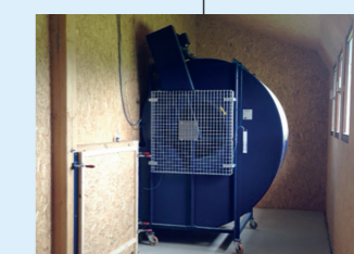
3 Ventilateur AGRIVENT™