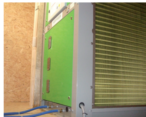
Solide construction en acier revêtu – écoulement de condensat

Solide construction en acier revêtu comportant un fond entièrement soudé en pente – pour assurer l'écoulement du condensat !