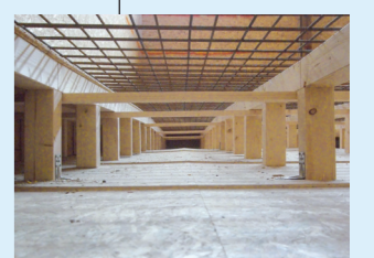
5 Fond d'aération