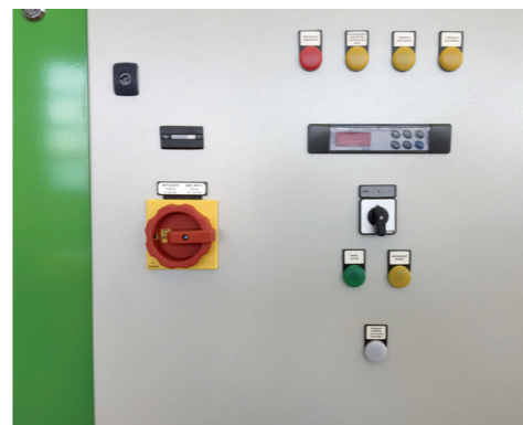
Commande entièrement automatique

Commande entièrement automatique et claire – le déshumidificateur est autonome !