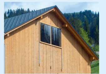
4 Clapet d'air d'échappement