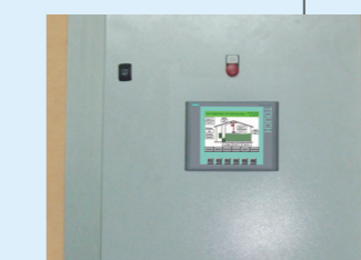
6 Commande AGRICONTROL