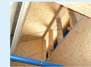
1 Clapet de recirculation d'air/ d'air extérieur