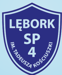
Grupa 0a – wych. Dorota Rybaczek

Przedstawiamy wszystkie klasy (oddziały przedszkolne i szkolne), które w tym roku uczą się w Szkole Podstawowej Nr 4 im. Tadeusza Kościuszki w Łęborku ☺