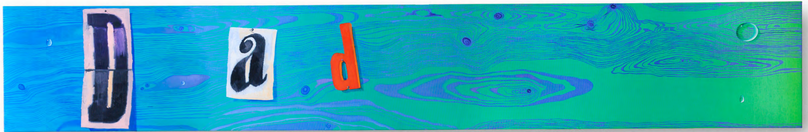
ASTRID KAJSA NYLANDER Plan C Oil on linen 30 x 190 cm 2022