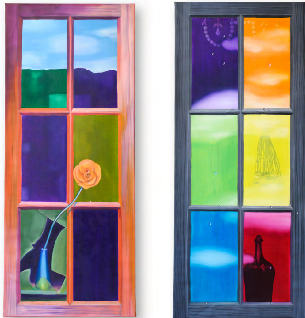
ASTRID KAJSA NYLANDER Separation (left and right) Oil on linen 2 x 120 x 50 cm 2022

in love connects with every detail and assigns them value. Like, for example, a birthmark that becomes something to talk about, a topic to be discussed. A glassy look and sensual feeling fool the eye that the surroundings no longer exist, just that mark alone is enough.