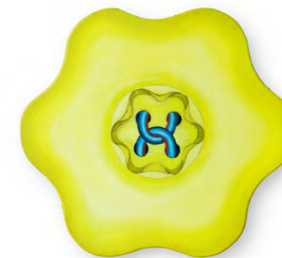
ASTRID KAJSA NYLANDER lemon-yellow minijob # 2 Oil on linen 29 x 31.5 cm 2022