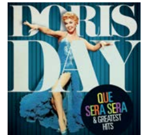
PJESMOM OD OSCARA DO OSCARA