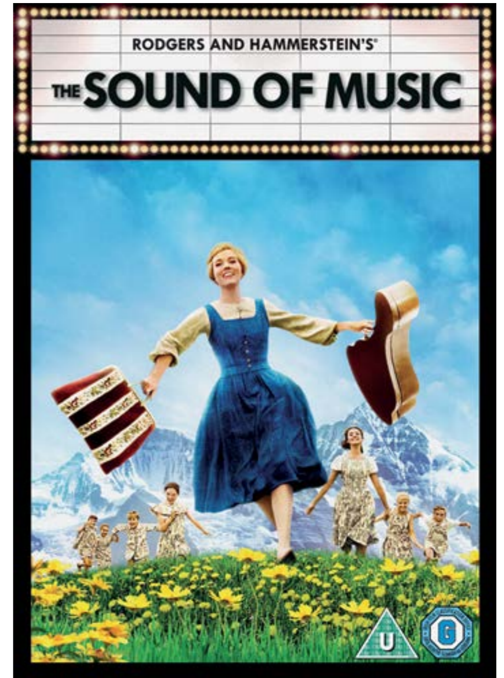
PJESMOM OD OSCARA DO OSCARA

Akademijin Odsjek za glazbu svake godine nominira pjesme za nagradu Oscar. Prvih desetak godina nije bio ograničen broj nominacija, ali kasnije, u skladu s novim pravilima, nikad ne prelazi pet nominacija, a iz jednog se filma mogu nominirati najviše dvije pjesme. Od šest songova nominiranih, primjerice, 1936. godine, tri su songa i danas često na repertoaru vokalnih interpretata jazza. To su "Pennies From Heaven", "I've Got You Under My Skin" i "The Way You Look Tonight". Izbor je tada pao na potonji