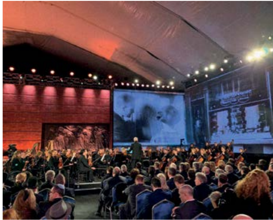
SVJETSKI FORUM O HOLOKAUSTU U IZRAELU

Emmanuel Macron pozvao je svijet da ne dopusti da se zaboravi Holokaust i da se ujedini protiv antisemitizma i mržnje. “Tamna sjena antisemitizma ponovno se rađa a ksenofobija je također podigla svoju ružnu glavu. Antisemitizam nije problem samo za Židove, to je prije svega