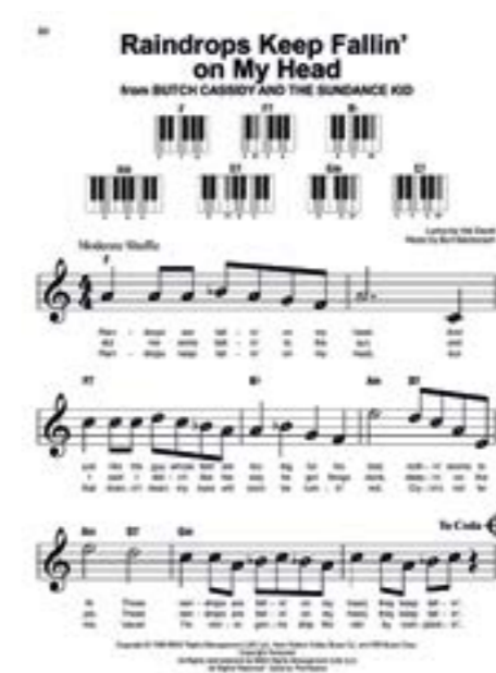
PJESMOM OD OSCARA DO OSCARA