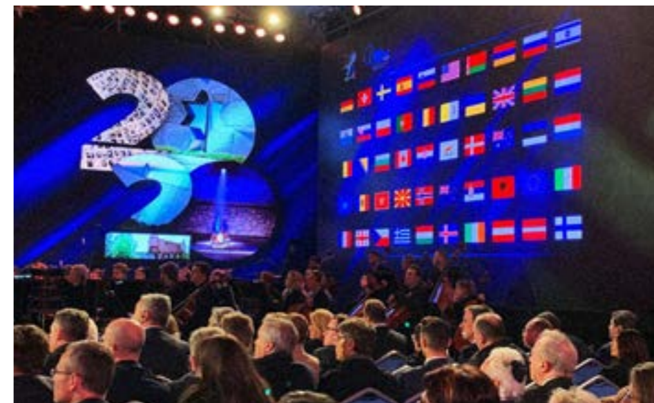
SVJETSKI FORUM O HOLOKAUSTU U IZRAELU

Uoči 75. obljetnice oslobođenja Auschwitz, izraelski predsjednik Reuven Rivlin ugostio je 40 šefova država i vlada, među njima francuskog predsjednika Emmanuel Macrona, ruskog Vladimira Putina i njemačkog Franka-Waltera Steinmeiera, britanskog princa Charlesa, američkog potpredsjednika Mikea Pencea kao i brojne druge predsjednike i šefove vlada, među kojima je bila i Kolumbina Grabar Kitarović. Bio je to najveći diplomatski skup ikad održan u Izraelu.