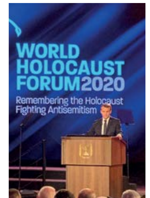
SVJETSKI FORUM O HOLOKAUSTU U IZRAELU

Okupljanje državnika Sveti grad je pretvorilo na jedan dan u svjetsku prijestolnicu. Uz odaslane poruke, blokirane ceste do Yad Vashema, polaganje vijenaca uz zvuke glazbe Viktora Ullmana, ubijenog u plinskim komorama Auschwitzta 1944., ostat će zabilježena i scena kada predsjednik Macron više na pripadnike izraelskih sigurnosnih snaga dok je ulazio u crkvu Svete Ane, objekt u vlasništvu francuske vlade. Glasoviti spor oko vlasništva očito traje i danas, pa Macron nije dopustio da ga tamo prate izraelski policajci, već samo francuski.