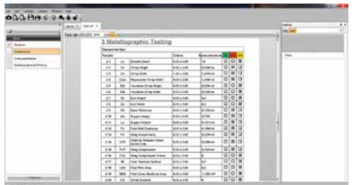
Die Testresultate können als individuelle Berichte erstellt werden.