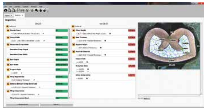
Die Mess-Grundfunktionen (Distanz, Fläche, Zähler, Winkel) lassen sich spezifisch erweitern.

SmartVision fügt sich leicht in das Produktionssystem von Unternehmen ein: Das Verwalten der Rechte, die Reportvorlagen und weitere Standards sind frei konfigurierbar. Zudem bietet das Programm diverse Spracherweiterungen. Der Support für Implementierung und Anwendung ist reaktionsschnell; Unternehmen profitieren so rasch von der SmartVision Software.