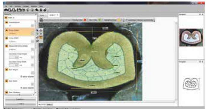
Die wichtigsten Messgrößen lassen sich vollautomatisch und bei Bedarf auch manuell vermessen.