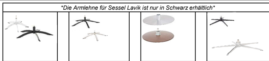
Fuß: Fuß A Fuß B Fuß C Fuß D Space Base Chrom Space Base Schwarz Tube Base gebürstet Tube Base Black Disk Base Holz Disk Base Metall Elegant Base alu gebürstet Elegant Base Black

Bei Bestellung von Fuß B ist der Stuhl 2 bis 2,5 cm höher.