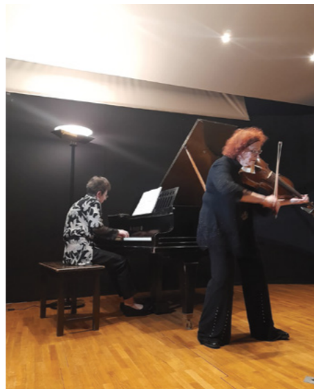
RIVKA GOLANI U ŽOZ-U

Studirala je na Glazbenoj akademiji u Tel Avivu kod Oedena Partosa. S 23 godine postala je članica Izraelske filharmonije. Seli u Kanadu sredinom 1970-ih gdje započinje svoju solo karijeru, a njezin sadašnji dom je London. Inspirativna je učiteljica koja na svoje