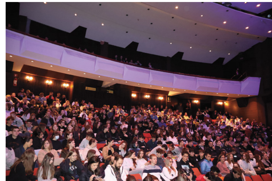
DAN SJEĆANJA, PROJEKCIJA FILMA “PRIČA OVADIJA BARUCHA” ZA ĐAKE SREDNJIH I OSNOVNIH ŠKOLA U CZK ČAKOVEC

Tijekom projekta održano je i niz aktivnosti. Koje su, prema Vašem mišljenju, bile najvažnije i na koje ste najponosniji?