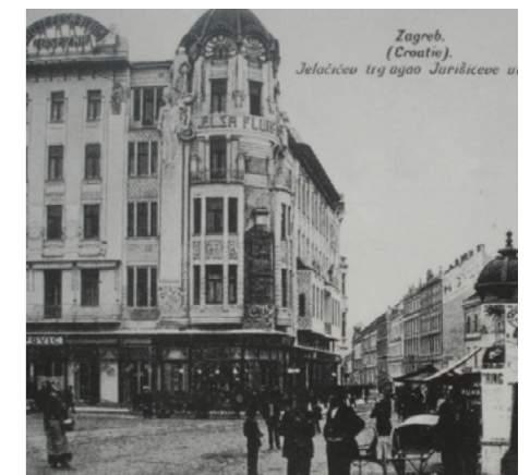
ZGRADA ELSA-FLUIDA NA TRGU BANA JOSIPA JELAČIĆA U ZAGREBU

“No ono što se dogodilo desetljećima kasnije je u potpunosti devastiralo taj ladanjski i ekskluzivni karakter Pantovčaka koji je danas sveden na tranzitnu cestu koja opskrbljuje pretjerano izgrađene sjeverne dijelove podsljemenske zone i potpuno je izgubio identitet sjeverne promenade”, kazao je.