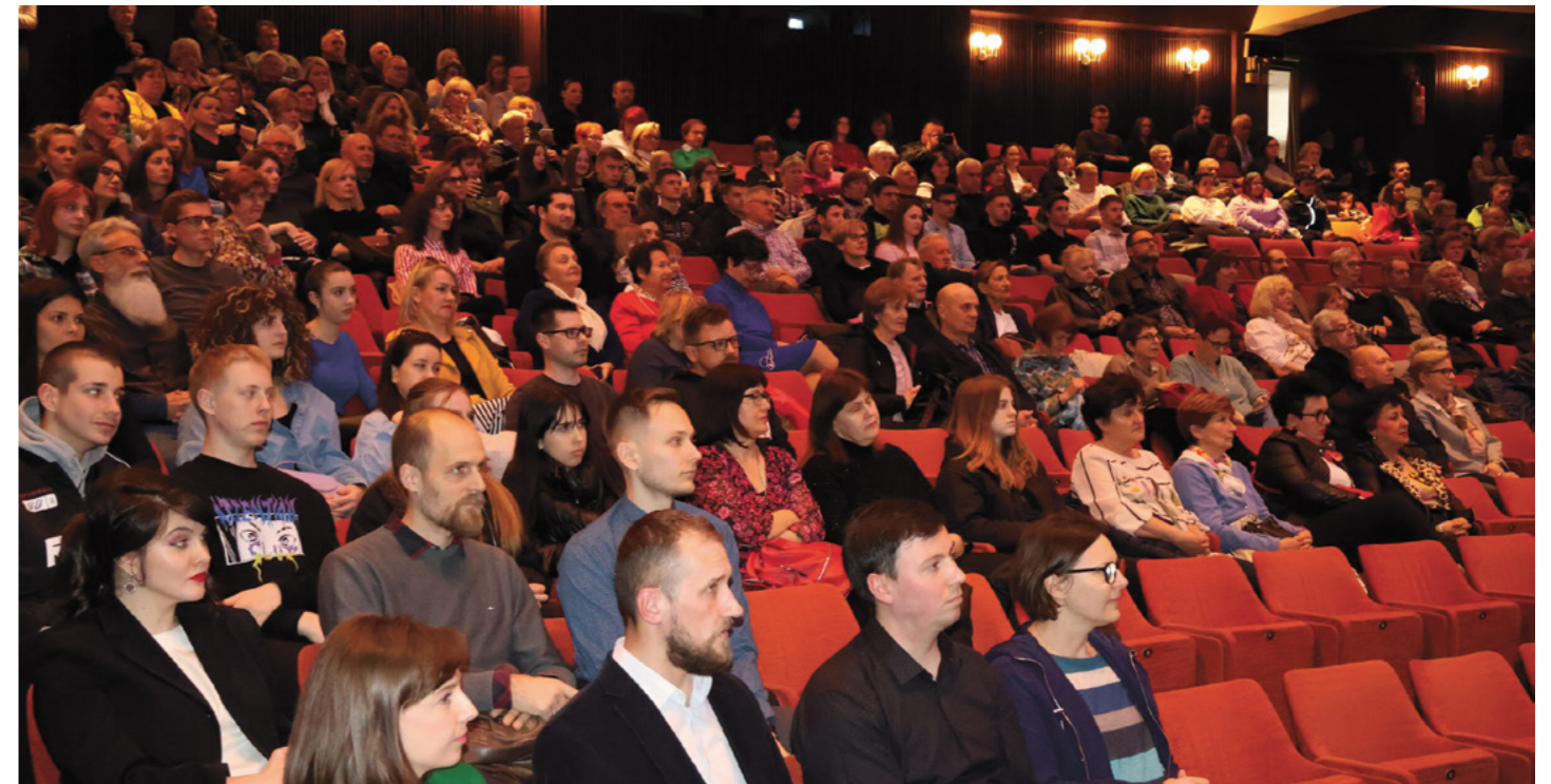
FOTOGRAFIJA SA ZAVRŠNE KONFERENCIJE PROJEKTA "NEVER FORGET" 27. TRAVNJA 2023. GODINE

Na nama je da učinimo sve da sjećanje na židovsku zajednicu ostane, da edukacija o povijesti židovske zajednice bude na kvalitetnijoj razini, da se prestane s prekranjem i zatiranjem povijesnih činjenica, a sve u cilju da se ne zaboravi. Da se ne zaboravi židovska zajednica, ali isto tako da se ne zaboravi tragična sudbina koju je ta zajednica doživjela, a sve zato da se tako nešto više nikada i nikome ne dogodi.