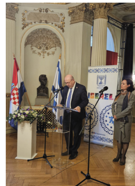
ROĐENDAN DRŽAVE IZRAEL U ZAGREBAČKOM HNK-U

“Postigli smo puno toga, a nadamo se da ćemo postići još mnogo više, čak i doći do Mjeseca, ali najviše se nadamo da ćemo postići mir. To nije lak zadatak s obzirom na naše izazovno susjedstvo, ali na njemu ne samo da radimo, već smo na tom polju postigli nevjerojatan napredak. Naravno, mislim na Abrahamove