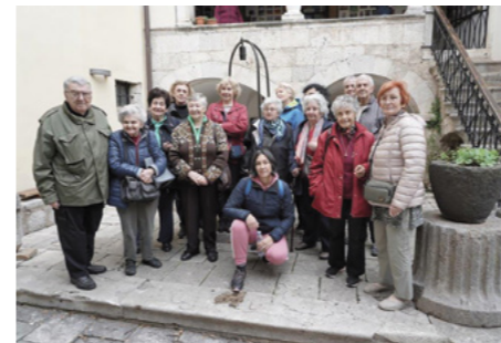
PREŽIVJELI HOLOKAUSTA NA DRUŽENJU

U Selcima, na Jadranskoj obali, organizirano je i ove godine tradicionalno druženje osoba koje su preživjele Holokaust u Hrvatskoj. Ova se druženja kod nas održavaju već petnaest godina u okviru programa "Cafe Europe" koji je pokrenula Claims konferencije. Svake godine raspisuje se natječaj na koji se javljaju organizacije i udruženja iz cijelog svijeta i predlažu svoje programe, mjesta održavanja i načine organiziranja.