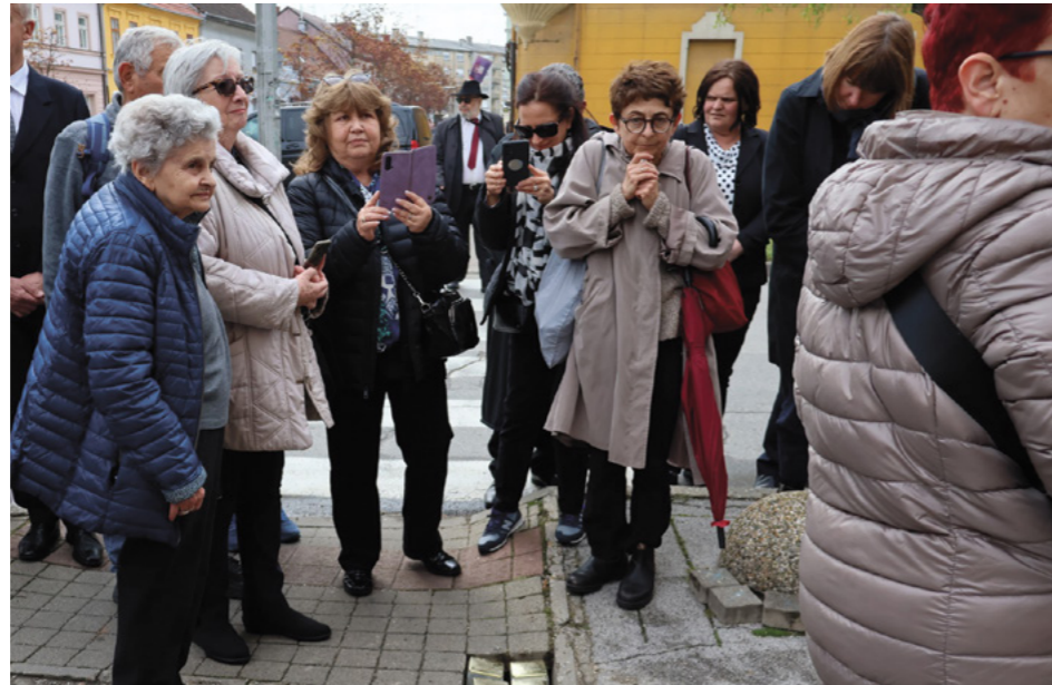
FOTOGRAFIJA S POSTAVLJANJA KAMENA SPOTICANJA 27. TRAVNJA 2023.