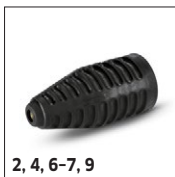
2, 4, 6-7, 9