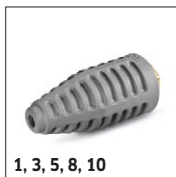
1, 3, 5, 8, 10