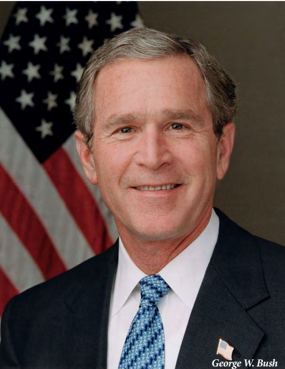
George W. Bush

Bu ortamda gidilen 1976 Seçimleri'nde Demokrat aday Jimmy Carter yeni başkan seçildi. Carter döneminde Nixon'ın SSCB ile başlattığı sağlıklı diyalog döneminin sonuna geldiğini söyleyebiliriz. Bu durumun başlıca sebepleri olarak İran'da gerçekleşen İslami devrimin SSCB yanlısı bir pozisyonda olması, Sovyetler Birliği'nin Afganistan'ı işgal etmesi ve ABD'nin içinde bulunduğu petrol krizi söylenebilir.