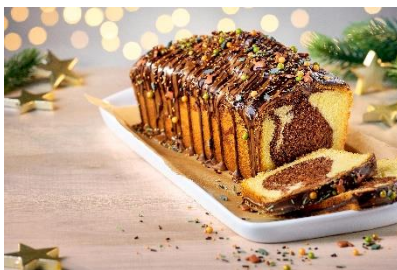
Weihnachtlicher Kasten Kuchen