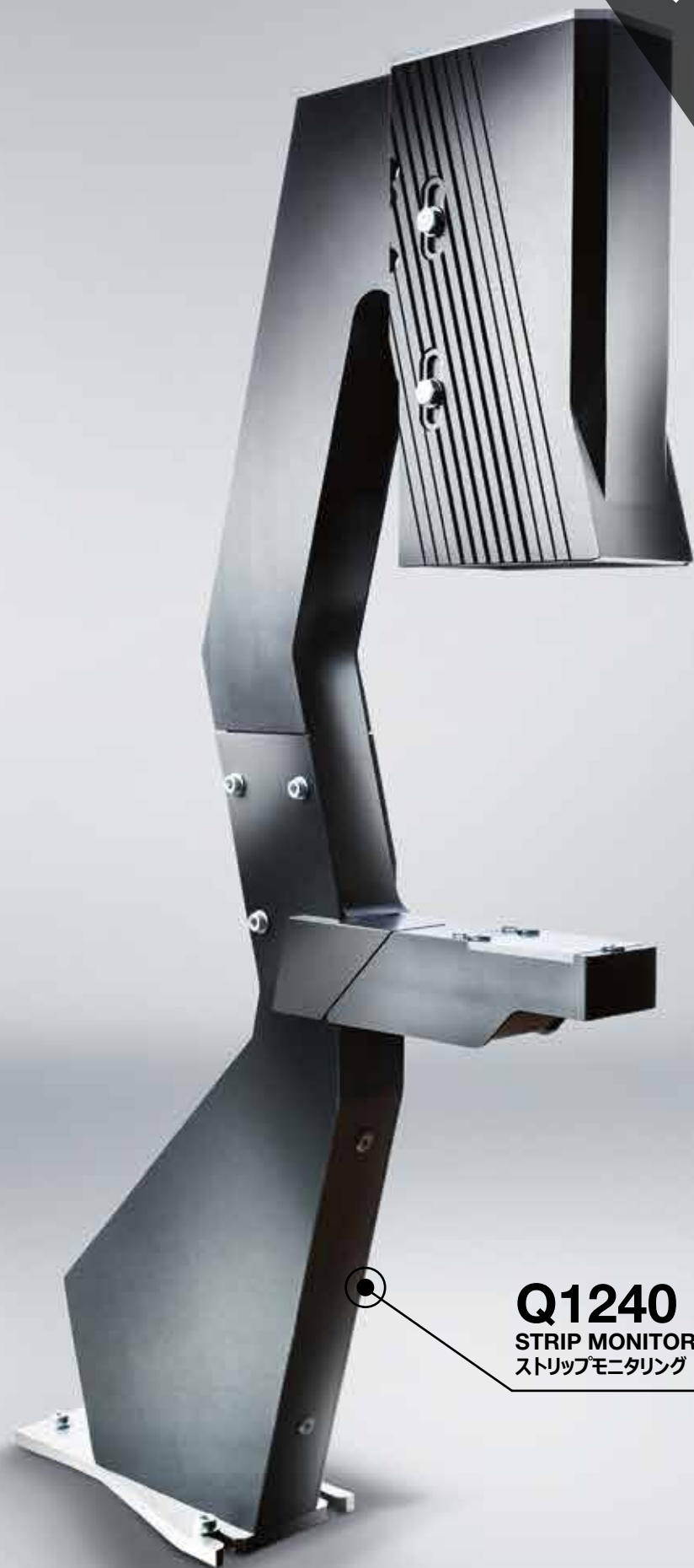
Q1240 STRIP MONITORING ストリップモニタリング