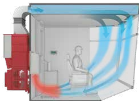
Fig. 3: procedimiento para la refrigeración de la cabina de grúa

El equipo de climatización para la refrigeración de cabinas de grúas se monta directamente en la pared de la cabina (Fig. 3). Funciona de forma especialmente silenciosa y es cómodo de manejar. En el modo de refrigeración, el aire entrante frío fluye por debajo del techo hacia la cabina de la grúa, mientras que en el modo de calefacción, el aire entrante caliente fluye por encima del suelo. Esto ofrece un confort óptimo para el operador de la grúa.