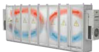
Fig. 2: procedimiento para la refrigeración del armario de distribución