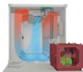
Fig. 1: procedimiento para la refrigeración de contenedores