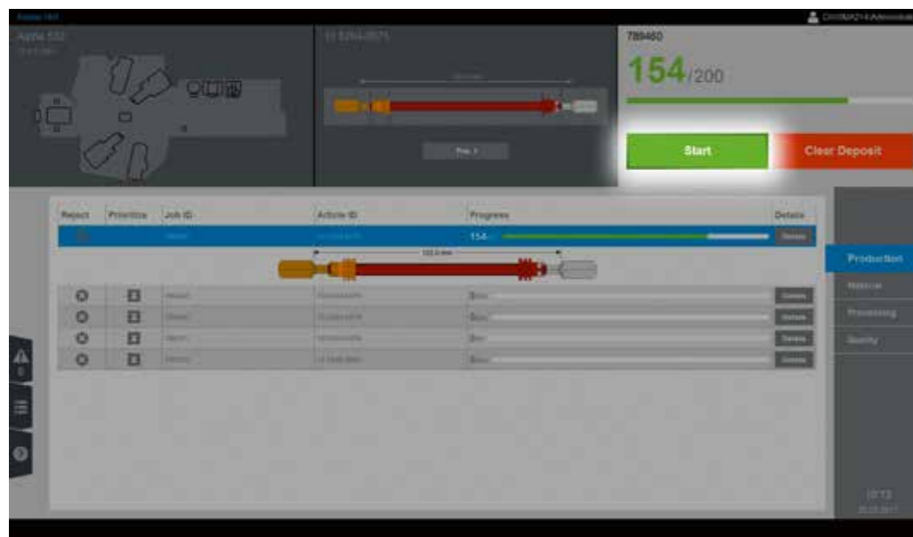
Mit dem Green Button Schritt für Schritt von der Auftragsliste, zum Materialwechsel, zu den Verifikationen bis zum Abschluss des Produktionsauftrags – einfach und fehlerfrei.